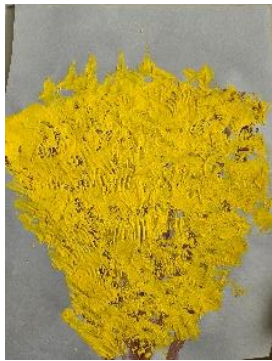
✍ Ana Simonič, 1. b