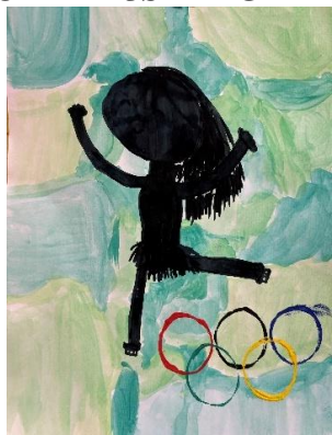
✍️ Tinkara Prezelj, 2. c