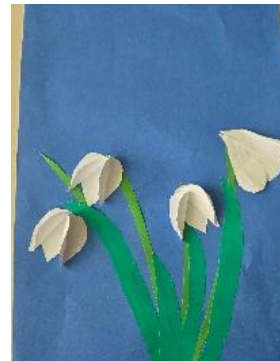
✍ Pina Arzenšek, 1. b