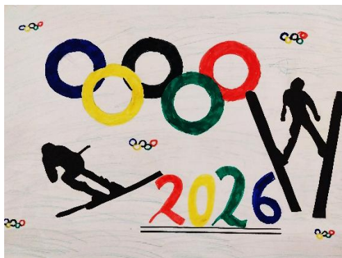
✍ Ajda Majcenovič, 4. b