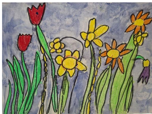
Izabela Sukič, 1. a