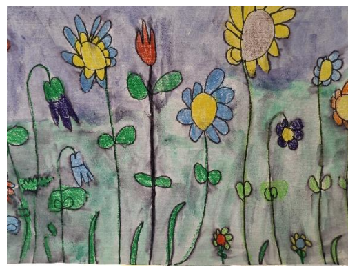
Vid Šut, 1. a