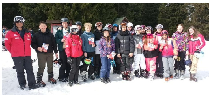
Sedmošolci v šoli v naravi ✉ Anita Babič