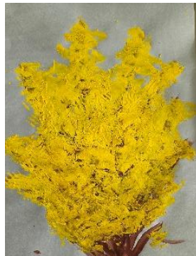
✍ Živa Hrovat, 1. b