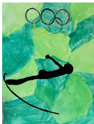
✍️ Zala Košir, 2. c