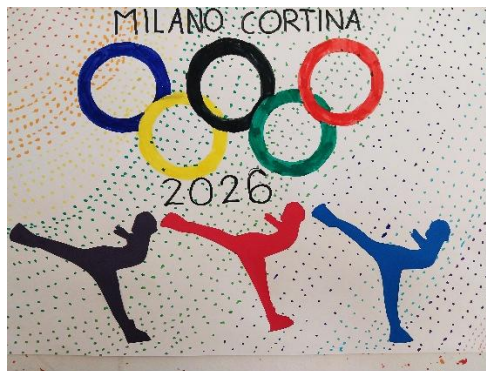
✍ Isa Peterka, 4. b