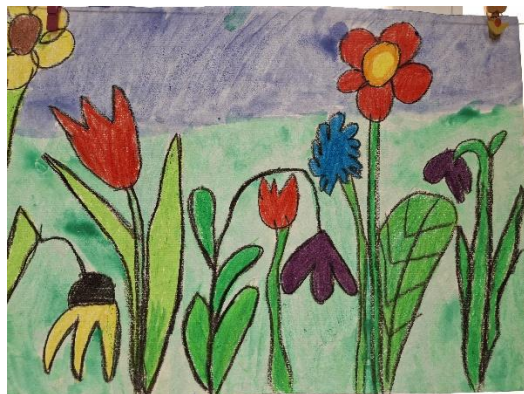
Ela Repa, 1. a