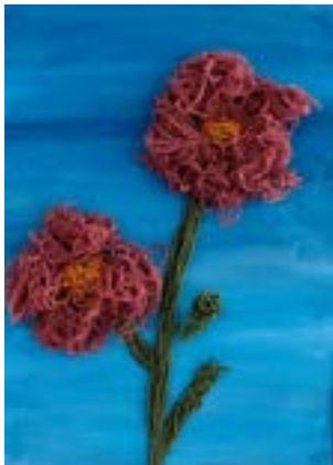
✍ Eva Roj, 4. b