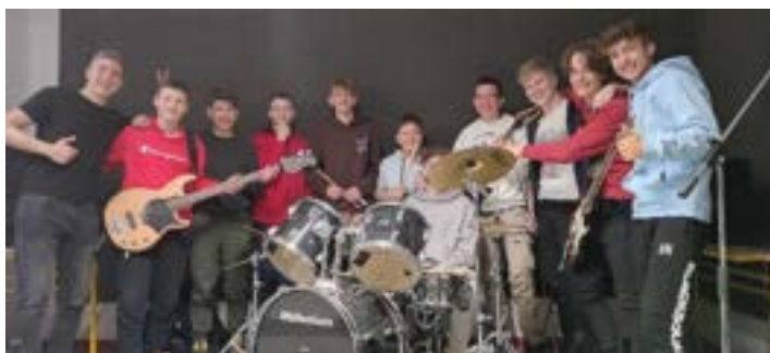
Tehniški dan na SERŠ (8. razred)