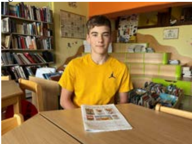
✍ Mateja Arko