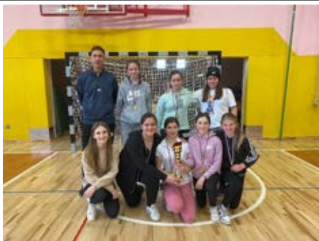
Rokomet: 1. mesto na občinskem šolskem tekmovanju