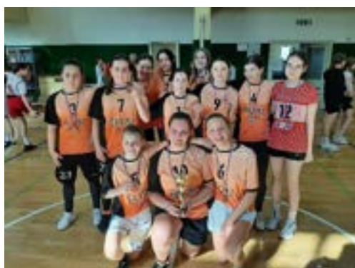
Košarka: regijsko šolsko tekmovanje (3. mesto)