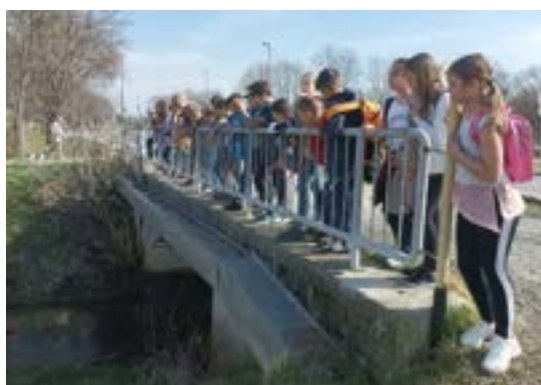
Naravoslovni dan, 4. a