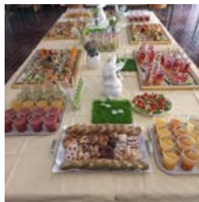
☞ Tanja Gojčič