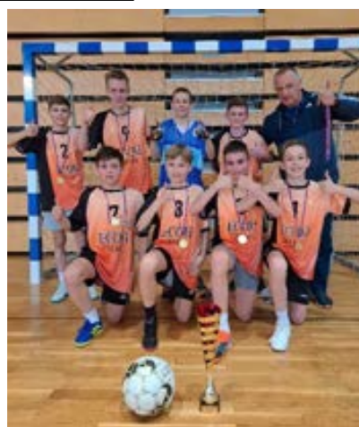
Nogomet: 1. mesto na občinskem šolskem tekmovanju