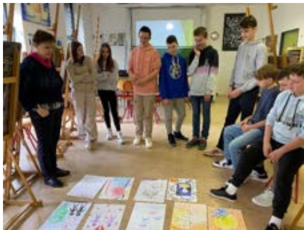
Dan dejavnosti na Srednji šoli za oblikovanje (8. razred)