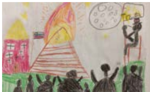
Anej Štampar Gregorec, 3. b