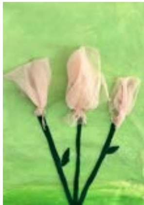
✍ Matic Petrej, 4. b