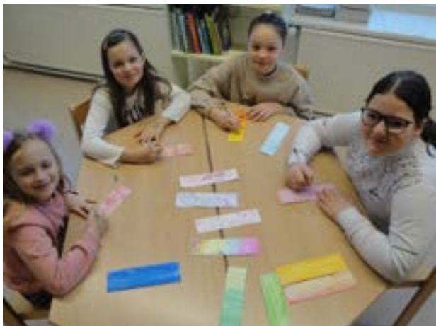
Izmenjava knjižnih kazalk