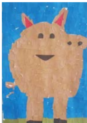
✍️ Anže Skuhala, 4. a